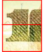
Tinta con cambio de color cobrizo a verde