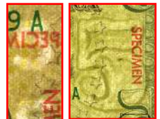
Marca de agua

Bajo la luz ultravioleta, el hilo de seguridad brilla azul.