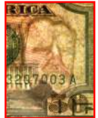
Marca de agua

Bajo la luz ultravioleta, el hilo de seguridad brilla amarillo.