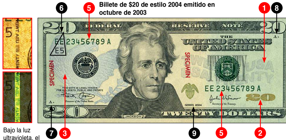
Billete de $20 de estilo 2004 emitido en octubre de 2003

Bajo la luz ultravioleta, el hilo de seguridad brilla verde.