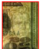
Marca de agua

Bajo la luz ultravioleta, el hilo de seguridad brilla verde.