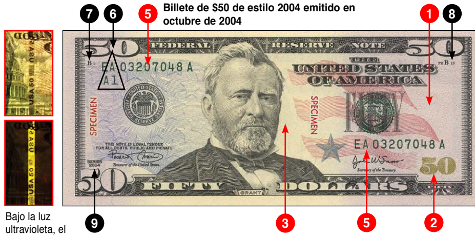
Billete de $50 de estilo 2004 emitido en octubre de 2004

Bajo la luz ultravioleta, el hilo de seguridad brilla amarillo.