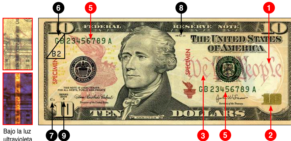
Billete de $10 de estilo 2004 emitido en marzo de 2006

Bajo la luz ultravioleta, el hilo de seguridad brilla naranja.