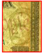
Marca de agua

Bajo la luz ultravioleta, el hilo de seguridad brilla naranja.