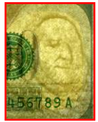
Marca de agua

Bajo la luz ultravioleta, el hilo de seguridad brilla rosado.