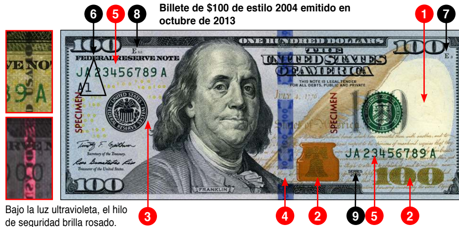
Billete de $100 de estilo 2004 emitido en octubre de 2013

Bajo la luz ultravioleta, el hilo de seguridad brilla rosado.